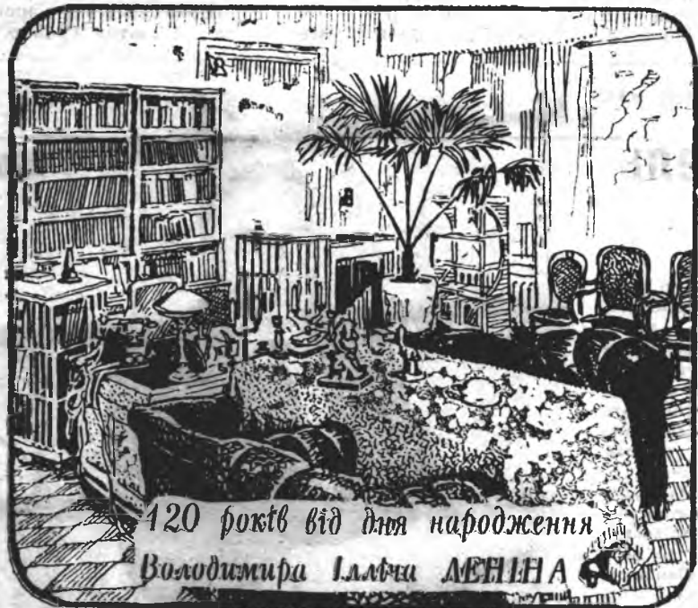
120 років від дня народження Володимира Ілліча ЛЕНІНА

Орган парткому, ректорату, профспілкових комітетів та комітету ЛКСМУ Івано-Франківського державного педагогічного інституту